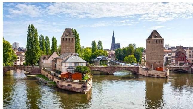
Le quartier de la « petite France ». Le barrage Vauban.