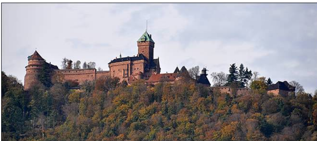
Le château du Haut-Koenigsbourg.