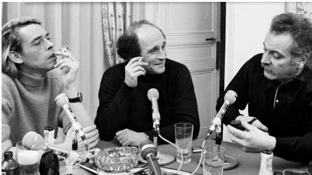
Photo du 6 janvier 1969 (émission de F.R. Christiani)

BRASSENS, BREL, FERRÉ CHANTENT LA LIBERTÉ