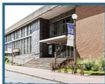
Musée des Beaux Arts 25 Rue Richelieu, 62100 Calais