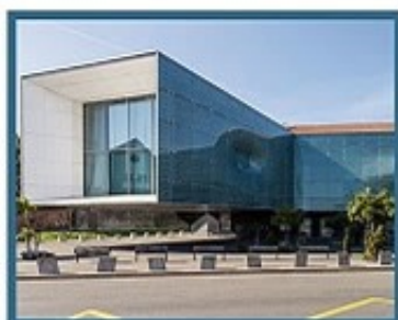
CIDM : Cité de la Dentelle et de la Mode 135 Quai du Commerce, 62100 Calais