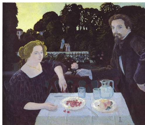
Le dessert au jardin. M. Denis.(1897)

Cet immeuble devint alors un foyer de vie artistique et culturelle. Il y reçoit ses amis notamment les peintres du groupe des « nabis » (prophète en hébreu) dont les principaux sont Paul Sérusier (1864-1927), Pierre Bonnard (1867-1947) et Edouard Vuillard (1868-1940). Des œuvres de ces différents peintres et de Paul Gauguin sont exposées dans le musée.