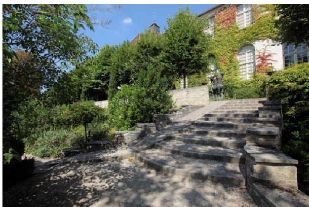
Façade et jardin du musée Maurice Denis

En 1914, le peintre Maurice DENIS (1870-1943) achète l'ancien hôpital général royal fondé par Mme de Montespan pour y abriter les indigents. Dans le jardin, en 1912, il avait fait construire par l'architecte Auguste Perret un atelier.