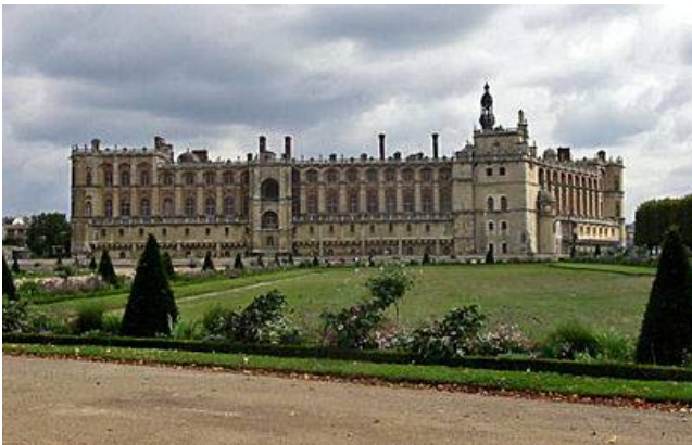
Le château de Saint-Germain-en-Laye.

Louis XIV est né ici et y passe toute son enfance.