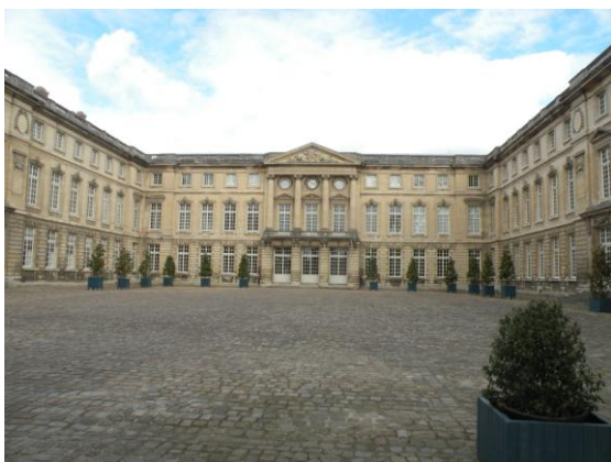
Palais impérial. Cour d'entrée.

Transformé et agrandi sous Louis XV, puis remis en valeur par Napoléon 1 er après la Révolution, le Palais de Compiègne fut l'une des résidences privilégiées de Napoléon III où il accueillit les plus grandes figures d'Europe. A partir de 1856, chaque année la cour vient passer cinq à six semaines à Compiègne. Les invités sont conviés par « Séries ». Chaque série dure une semaine et comporte une centaine d'invités, princes, ministres, ambassadeurs . . . logés au château. Les appartements de l'empereur et de l'impératrice déclinent tous les fastes du second Empire, dans des ensembles richement meublés. La visite permet d'aller à la rencontre des têtes couronnées qui y ont résidé et de partager les divertissements de la cour.