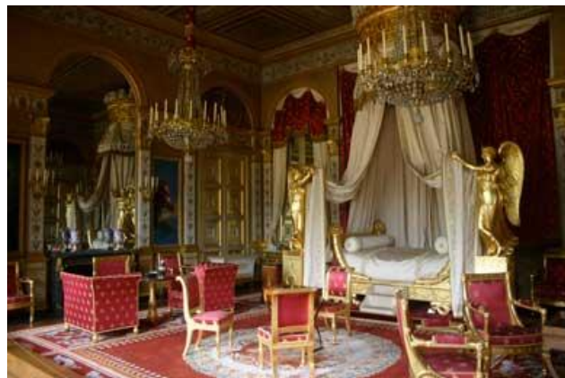
Chambre à coucher de l'Impératrice.

Le musée du second Empire regroupe une collection exceptionnelle de peintures, sculptures, meubles et objets d'art, reflet des réceptions somptueuses des Séries organisées durant cette période.